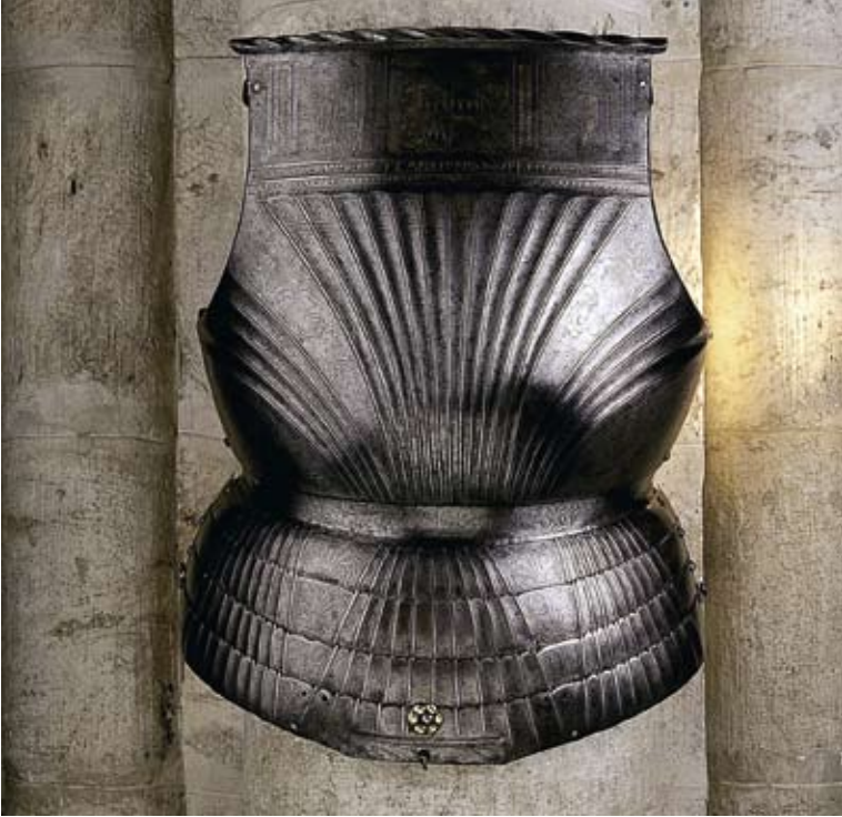
Brustharnisch des Walliser Politikers Georg Supersaxo. Mailänder Werkstatt, um 1510.

Susten. Doch waren die Folgen auch kultureller Art: Der Handel brachte künstlerische Vorbilder ins Land und ermöglichte den Erwerb ausländischer Luxusprodukte, besonders in den Zentren des Haupttals.