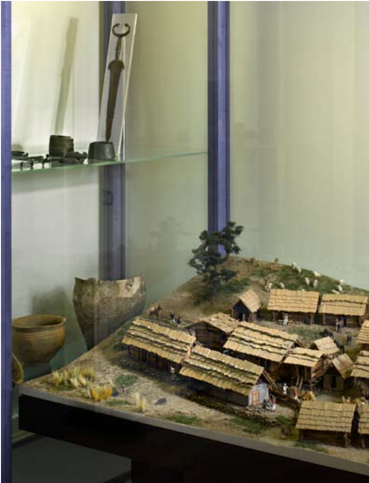
Rekonstruktion der urgeschichtlichen Siedlung von Gamsen bei Brig, Eisenzeit, um 600 v. Chr. Modell Hugo Lienhard, Mies (VD).

In den Seitentälern bilden sich – vor allem entlang der Durchgangsrouten – Siedlungen. Zwischen dem 2. und 1. Jahrhundert v. Chr. entwickelt sich der Handel mit dem Süden, vor allem mit Rom. Und im Wallis hält die Münze Einzug.