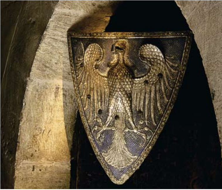
Schild mit dem Wappen der Herren von Weingarten oder Raron, um 1300.

Die mittelalterlichen Sammlungen des Geschichtsmuseums sind äusserst wertvoll. Eine wichtige Rolle spielen dabei die Dauerleihgaben des Domkapitels mit Objekten von internationaler Bedeutung. Die meisten dieser Objekte, so zum Beispiel die berühmten Sakristeitrühen, stammen von Valeria. Sie widerspiegeln auf eindrucksvolle Art die prunkvolle Seite des bischöflichen Hofes. Nur spärlich erhalten sind demgegenüber die einfachen Gegenstände des Alltagslebens. Sie sind dargestellt in Form von Abbildungen auf Walliser Kunstwerken sowie durch die Rekonstruktion des Herstellungsprozesses eines mit einer für das Mittelalter typischen Wippdrehbank gefertigten Holznapfs.