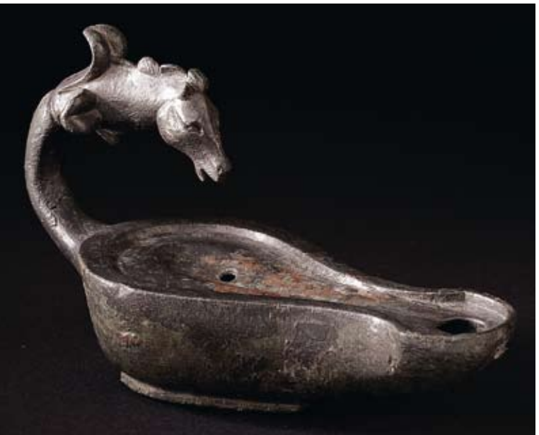
Öllampe aus Bronze, wahrscheinlich in Kampanien. hergestellt, in Massongex ausgegraben (1. Jahrhundert n. Chr.).

Das Wallis tritt in die geschriebene Geschichte ein, als Rom sich im Rahmen seiner Expansionspolitik nach Norden für die Kontrolle des Übergangs über den Grossen St. Bernhard zu interessieren beginnt. Die lateinischen Autoren erwähnen in ihren Berichten die vier damaligen Volksgruppen im Wallis: Die Nantuaten im Chablais, die Veragriner in der Region Martigny, die Seduner im Mittelwallis und die Uberer im Oberwallis. Um 15 v. Chr. „erobern“ die Römer das Wallis. Um 47 n. Chr. wird am Fusse des Grossen St. Bernhardpasses