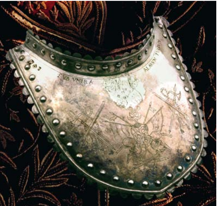
Hause-Col von Kaspar Jodok Stockalper (2. Hälfte 17. Jahrhundert).

Von der bischöflichen Grafschaft zur Republik der sieben Zenden (Bezirke): eine neue Oligarchie an der Macht 1600-1800