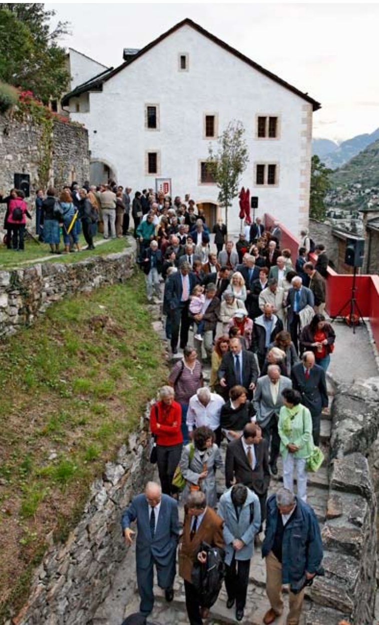
Nach dem offiziellen Teil... Vernissage vom 12. September 2008.