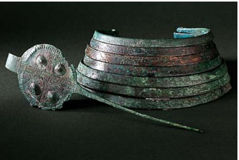
Schmuck, wie er für die Rhone-Kultur charakteristisch ist: Halsringe und Gewandnadeln aus Bronze (um 1'800 v. Chr.).

Die Alpen haben nie ein unüberwindbares Hindernis dargestellt. Im Gegenteil. Die Kelten der Eisenzeit (800-15 v. Chr.) weisen eine Kultur mit typisch alpinen Zügen auf, die aber eindeutig die starke Verbindung mit dem Süden (Aostatal, Piemont, Tessin) erkennen lässt.