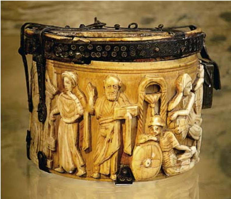
Pyxis, als Reliquiar wieder verwendet (1. Hälfte 6. Jahrhundert). Szene mit den Frauen am Grab.

eine neue Siedlung gegründet: die Provinzhauptstadt Forum Claudii Vallensium (das heutige Martigny). Vor allem abseits der grossen Verkehrswege bleibt der römische Einfluss jedoch beschränkt und neben der offiziellen Religion werden verschiedene lokale Kulte geduldet. Die Durchmischung der Bevölkerung und der Durchzug römischer Legionen aus fernen Gegenden führen zudem zur Verehrung neuer orientalischer Gottheiten wie Mithras. Letztendlich setzt sich das Christentum durch, währenddem die anderen Kulte verschwinden. Das Christentum breitet sich rasch im ganzen Wallis aus. Der erste bekannte Bischof, der heilige Theodor (oder Theodul), wird 381 in der Konzilakte von Aquileja erwähnt.