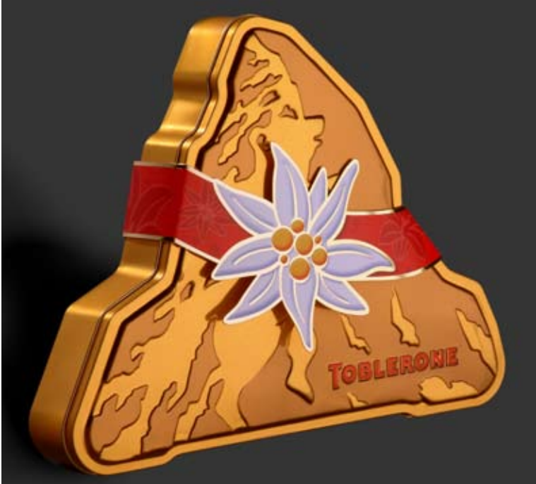
Verpackung für Toblerone-Schokolade mit der Darstellung des Matterhorns.

Das Matterhorn ist zweifelsohne das Markenzeichen der Walliser Alpen schlechthin. Seine unverkennbare pyramidale Gestalt macht es zum Markenzeichen der Schweiz, ähnlich dem Schloss Chillon, dem Springbrunnen in Genf oder der Kapellbrücke in Luzern. Doch hat seine Berühmtheit die Landesgrenze längst überschritten und seine Silhouette wird weltweit als Werbeträger für den Verkauf von Natur- oder Wellnessprodukten und anderes mehr genutzt.