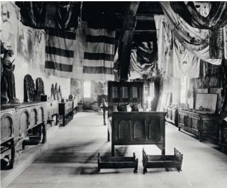
Der Saal der „Neun Helden“, der Mittelpunkt des Geschichtsmuseums, wie er sich zu Beginn des 20. Jahrhunderts präsentierte.

Ab 1985 werden die Museumsgebäude im Rahmen einer umfassenden Restaurierung von Schloss Valeria saniert, technisch überholt, durch einen geänderten Rundgang erschlossen und vollständig neu eingerichtet. Die neue Präsentation wird 2008 eröffnet und bietet eine chronologisch angeordnete Zusammenfassung der Walliser Kulturgeschichte von 50'000 vor unserer Zeitrechnung bis heute an.