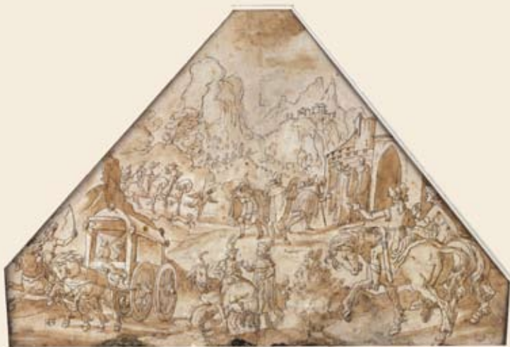
Hans Heinrich Wägmann, Pilger vor der Abtei Saint-Maurice, vorbereitende Zeichnung für eine Gemäldeszene im Giebel der Kapellbrücke in Luzern, 1612.

Seit frühester Zeit haben die Walliser Alpenpässe Grosser St. Bernhard und Simplon als schnelle Nord-Südverbindungen eine wichtige historische Rolle gespielt. Sie verliehen dem Wallis insbesondere im Mittelalter und auch später europäische Bedeutung. Die günstige strategische Lage zeigte vor allem wirtschaftliche Auswirkungen: Löhne für Maultierführer, Zölle, Einnahmen für Hospize und